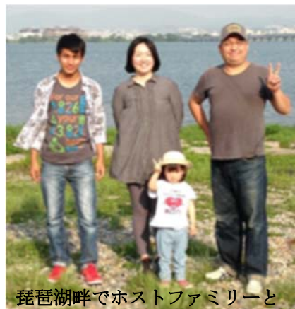
琵琶湖畔でホストファミリーと